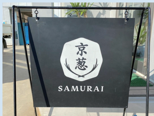
京葱 SAMURAI ロゴ

展示会に多数出店するなど「SAMURAI 九条ねぎ」のPRを積極的に行っておりますので、当社に興味のある方がいらっしゃいましたら、ぜひともお声掛けください。お待ちしております。