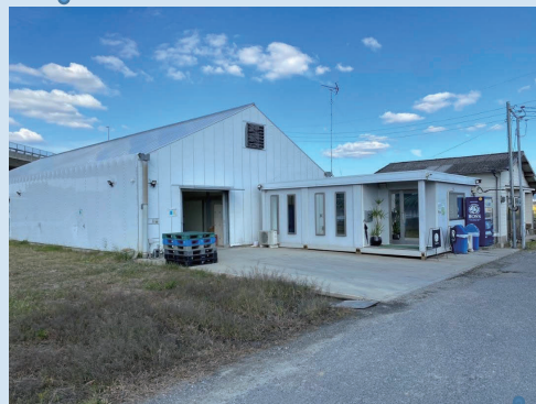
加工場（左）と事務所（右）