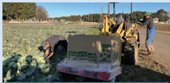
収穫機が入る道を作ることで収穫も効率化