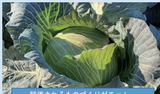
評価されるものづくりがモットー

現在、24ヘクタールの自社ほ場でキャベツを栽培していますが、作付面積の拡大に向けた設備は整っており、生産量の増加を目指しています。