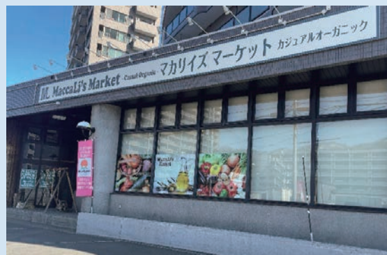
マカリイズマーケット（札幌市内）

MaccaLi（マカリイ）という社名は、自然豊かな羊蹄山のふもとにある北海道真狩（まっかり）村に由来しています。