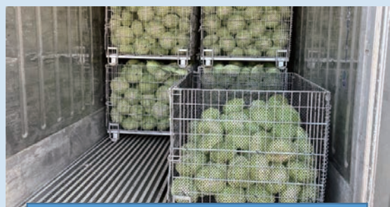
キャベツの鮮度を保つ保冷库