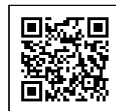
↑ alic Facebook

事態の発生原因によっては、Facebookのみのお知らせという場合もありますので、alicホームページ → Facebookの順にご確認をお願いします。