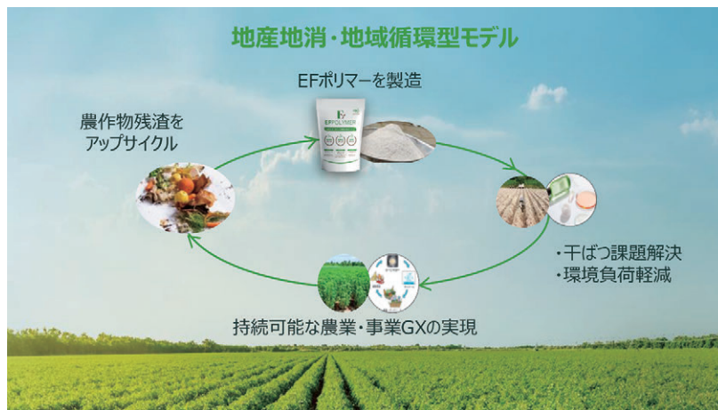
図2 EFポリマーが目指す地産地消・地域循環型モデル

最後に、EFポリマーの製造方法は、果物の皮などの作物残渣を乾燥、粉碎した後に多糖類を取り出し、当社特許技術を駆使し生成する（水を吸う素材に変化させる）という非常にシンプルな設計になっていることから、SAP製造と比較して設備投資を含む初期費用が抑えられることも特長だ。この特長を生かすことで、EFポリマーを使用した農地で育てられた作物の残渣を活用し、次のEFポリマーの製造へとつなげる「地産地消・地域循環型モデル」の実現が可能となる（図2）。