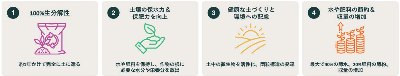
図1 EFポリマーの機能と効果

EFポリマーと化学SAP製品の機能や効果を比較した際のポイントとしては、製品の形状や推奨利用量・散布方法などには大きな違いはない。しかし、完全生分解性を有するEFポリマーと異なり、化学SAPは完全生分解性を有さず土壌に残留物を残す（＝土壌を汚染してしまう可能性がある）ことに加え、化学SAPと化学肥料が反応し化学SAPが吸水力を失ってしまうという課題がこれまで指摘されてきた。また、EFポリマーの吸水量が自重の50倍である一方で、化学SAP製品は200～400倍と吸水量に違いがあるが、こと植物の育成においては「吸水量が多かろう、良かろう」ではないと考えている。その理由の一つとして、吸水量の多さは吸収した水