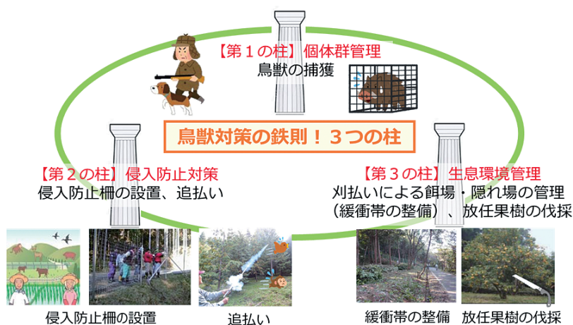
図2 鳥獣被害対策の三つの柱

農林水産省では、鳥獣による農林水産業等に係る被害の防止のための特別措置に関する法律を踏まえ、鳥獣被害防止総合対策交付金により、市町村が作成する「被害防止計画」に基づく3本柱など、地域ぐるみの対策を支援しています。この中で、センサーカメラやドローン、ワナの遠隔監視・操作システム、ICTなど新技術の導入も支援対象となっています。鳥獣対策でお困りの方で相談をご希望の方は、市町村鳥獣被害対策ご担当までお問い合わせください。