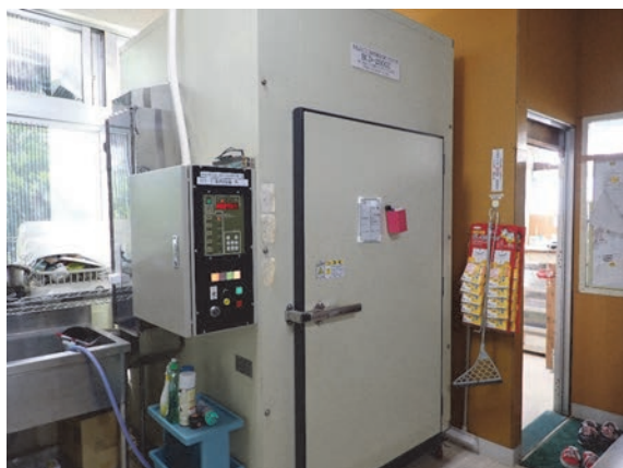
写真3 減圧低温乾燥機