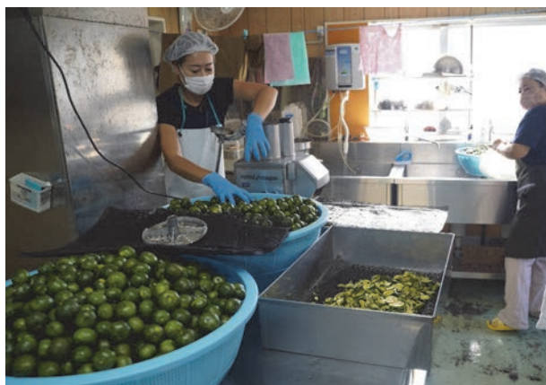
写真4 農産物の加工を行う社員の方々