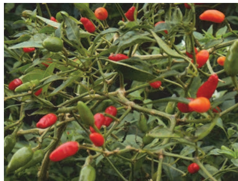
写真2 天に向かって実をつけるのが特徴の島とうがらし