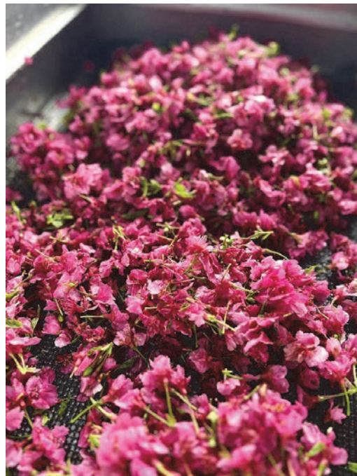
写真6 OEMで製造する寒緋桜の乾燥工程の一部