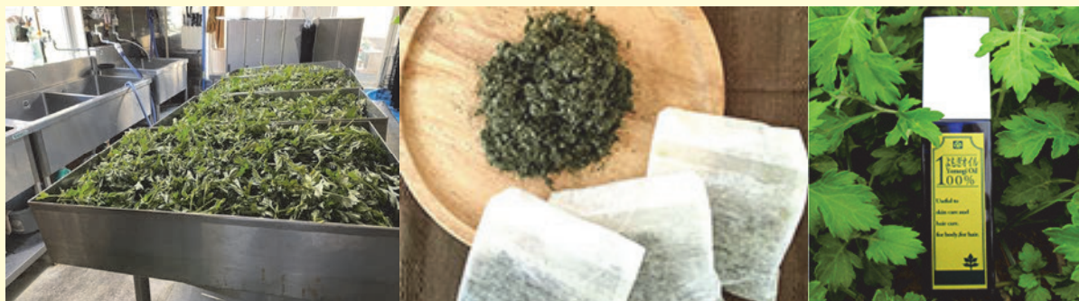
コラム1－写真 左から、収穫したにしよもぎ、加工した入浴剤、よもぎオイル

同社では自社農園および地元農家で無農薬栽培されたよもぎを用いて入浴剤やよもぎオイルなどの販売を手掛けている。また、近年は美容サロンなどへ「よもぎ蒸し（加熱したよもぎから出る蒸気で身体を温める施術）」としても供給している。減圧低温乾燥技術を用いることでよもぎ本来の香りが強く残り、利用者から好評を得ている。蒸されたよもぎの蒸気は、特性上、顔や身体に直接触れることから、その原料であるよもぎは国産かつ無農薬であることが付加価値を高める要素となっている。そのため、調達先の地元農家にも自社の理念や無農薬で栽培する意義をしっかりと説明し、生産者の理解が得られるように努めているという。