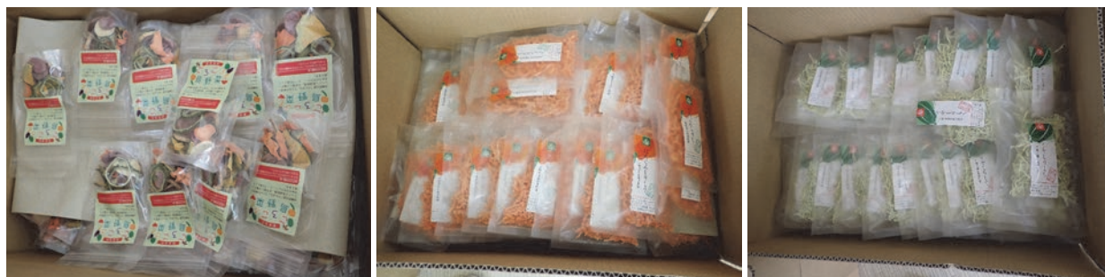
写真5 各地で開催される沖縄フェアでの販売商品 「ごろごろ島野菜」(左)と「しりしりシリーズ(にんじん(中央)とパパイヤ(右))」

なお、これらの商品は、各地で開催される沖縄フェアやイベントへの出店、ヤフーショッピングなどの電子商取引（EC）サイトでも販売されている（写真5）。