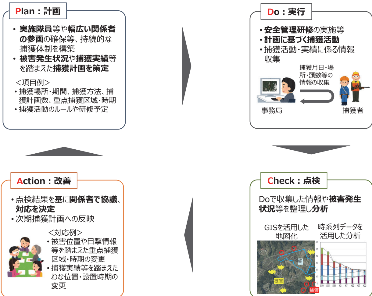
図3 捕獲活動におけるPDCAの実践

農林水産省では、「鳥獣による農林水産業などに係る被害の防止のための特別措置に関する法律」を踏まえ、鳥獣被害防止総合対策交付金により、市町村が作成する「被害防止計画」に基づく3本柱など、地域ぐるみの対策を支援しています。