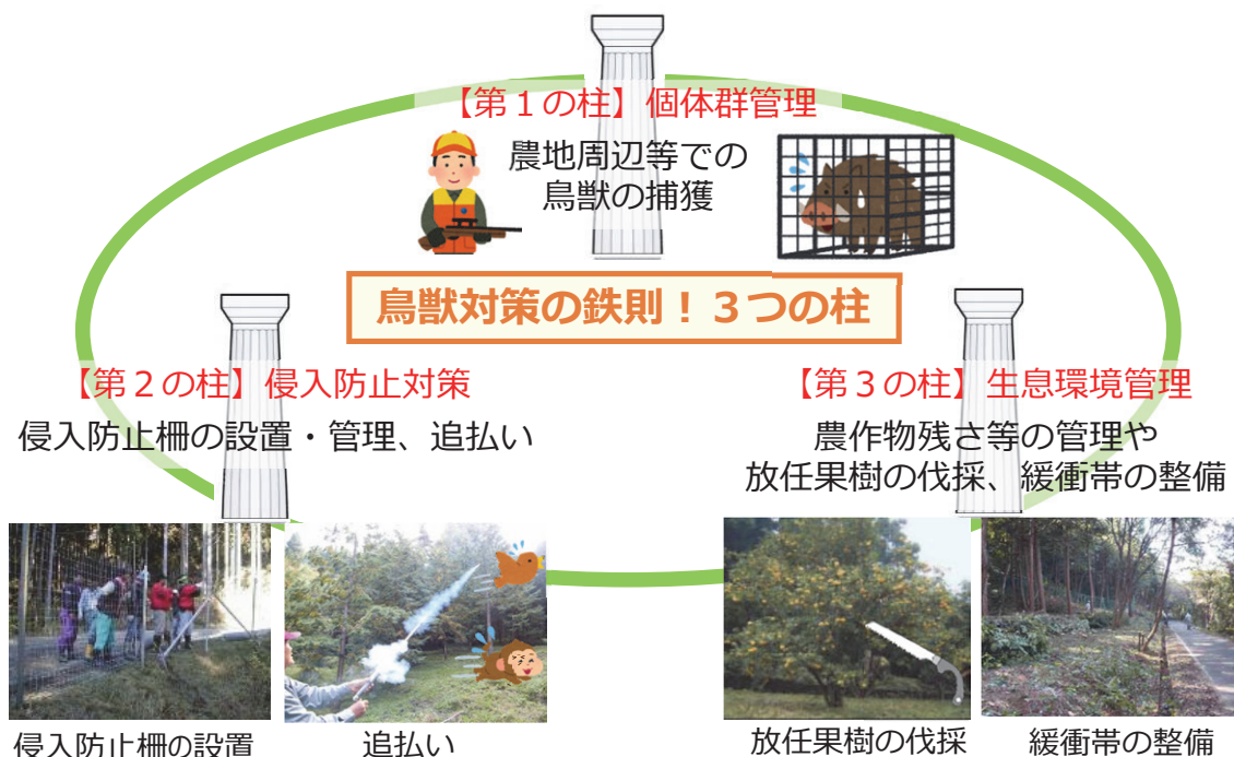
図2 鳥獣被害対策の3つの柱

鳥獣被害対策の担い手の減少・高齢化により、捕獲従事者や柵の管理者などの人手不足が